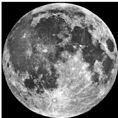
Рис. 1 Фотография Луны