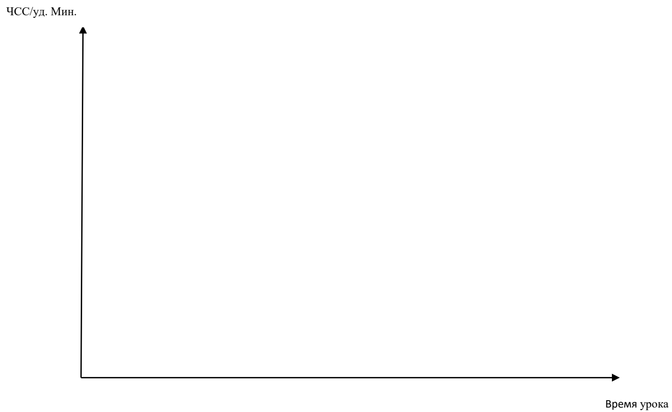
Рис. 1. График кривой пульса учащегося в процессе урока