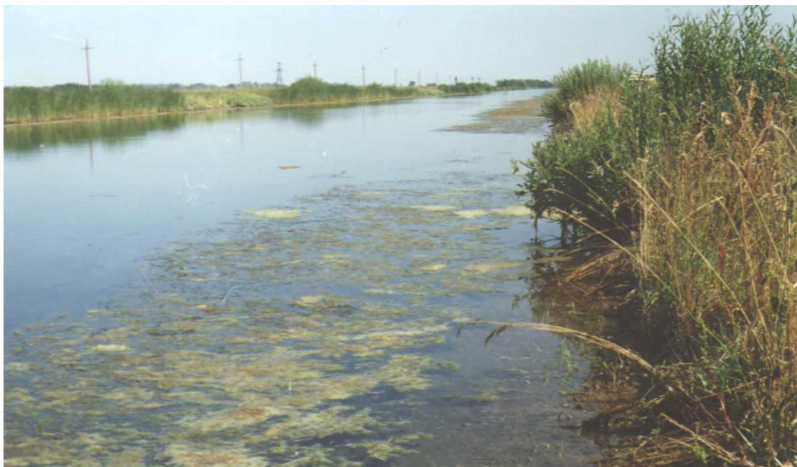
Рис. 1. Куйбышевский обводнительно-оросительный канал